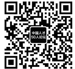
中国人才50人论坛二维码