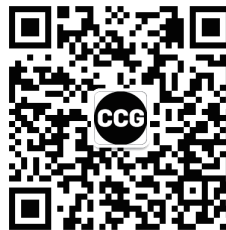
全球化智库 (CCG) 二维码